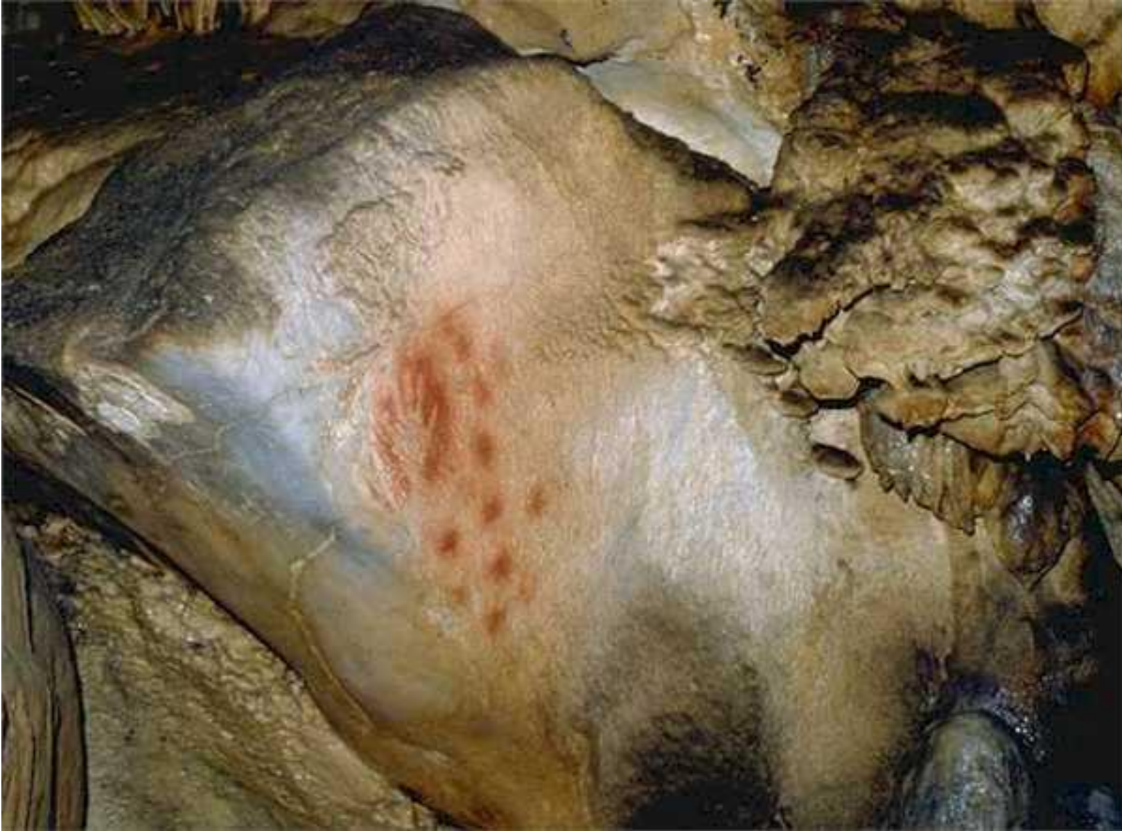
GROTTE PECH-MERLE (France)