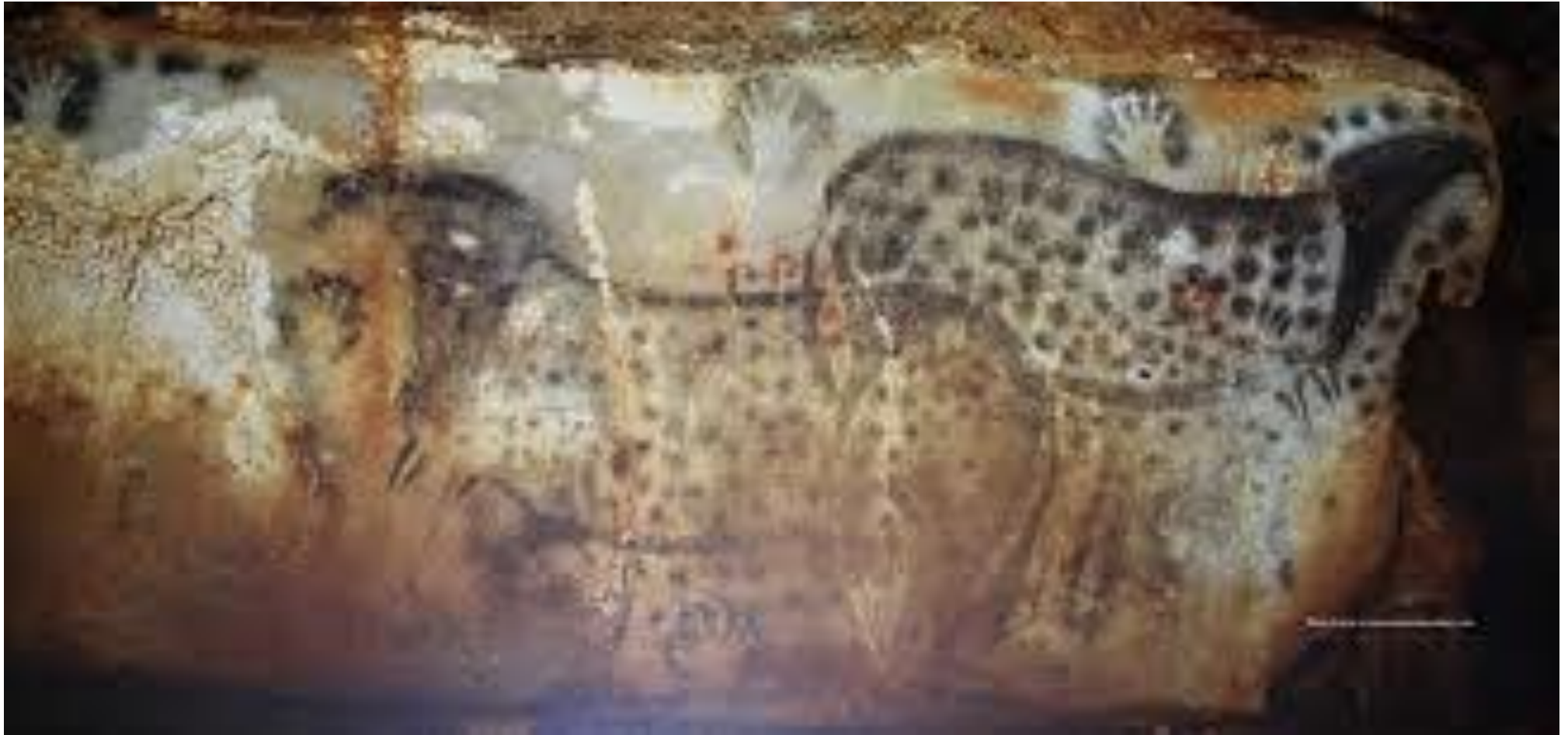
GROTTE PECH-MERLE (France)