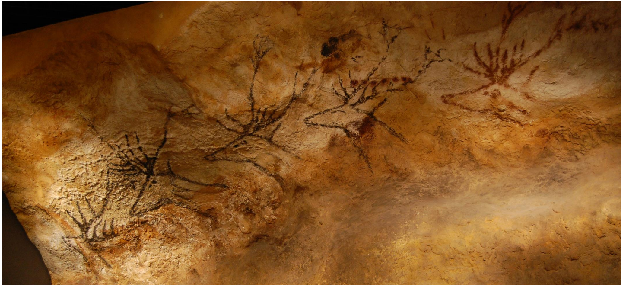
GROTTE DE LASCAUX (France)