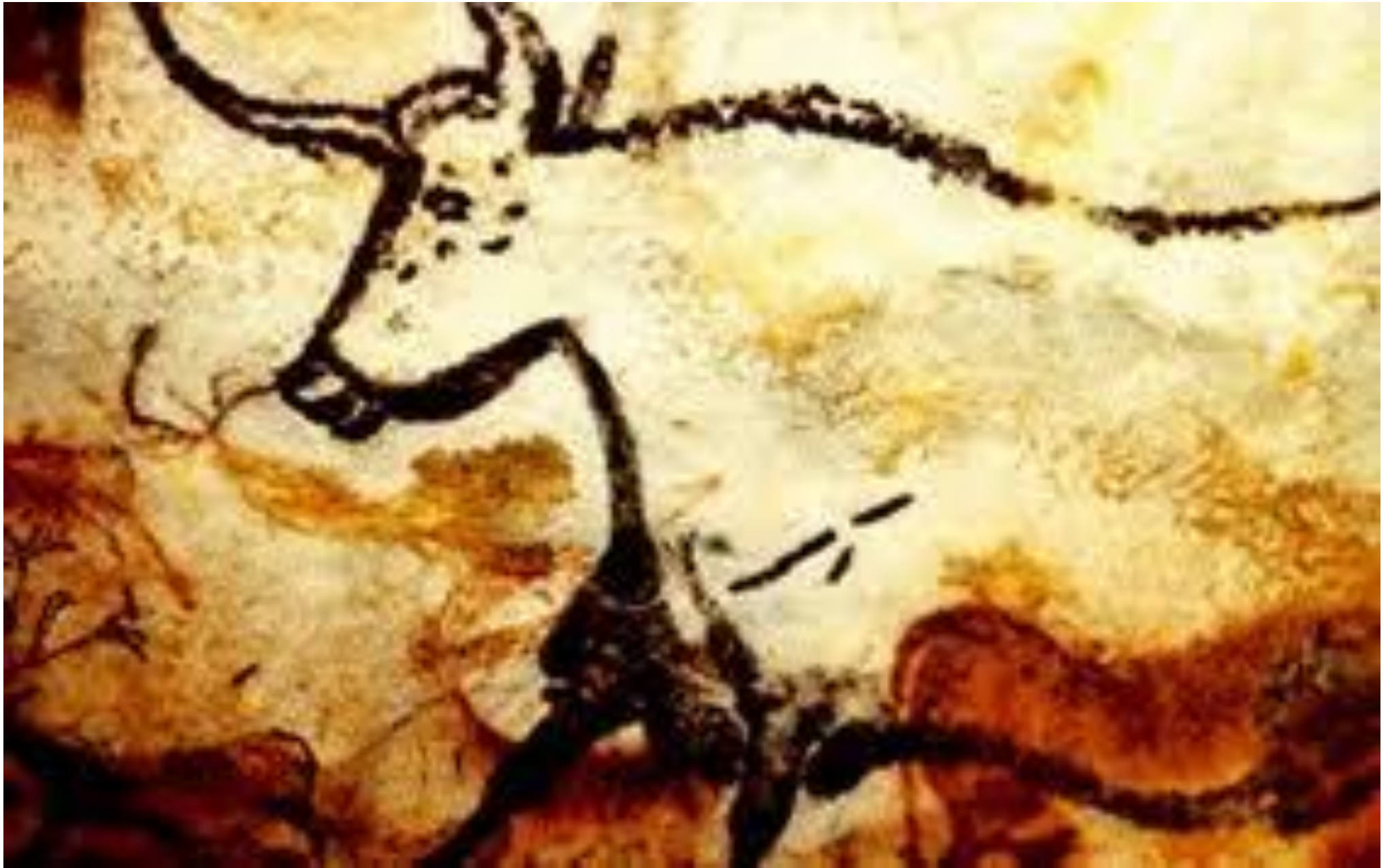
GROTTE DE LASCAUX (France)