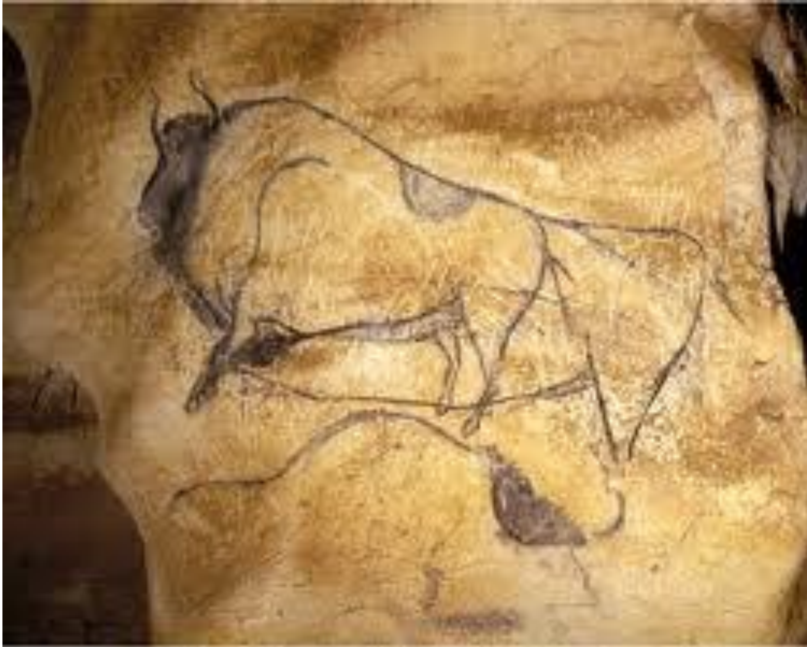
GROTTE CHAUVET (France)