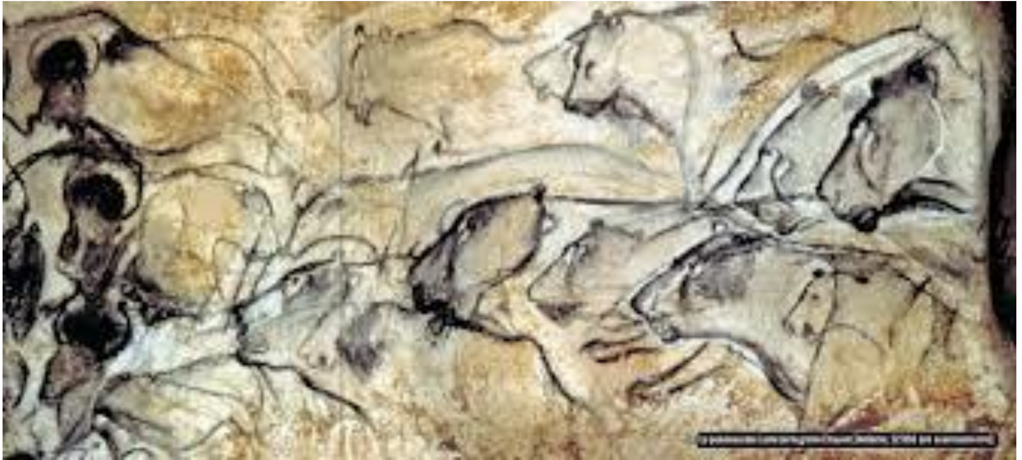
GROTTE CHAUVET (France)