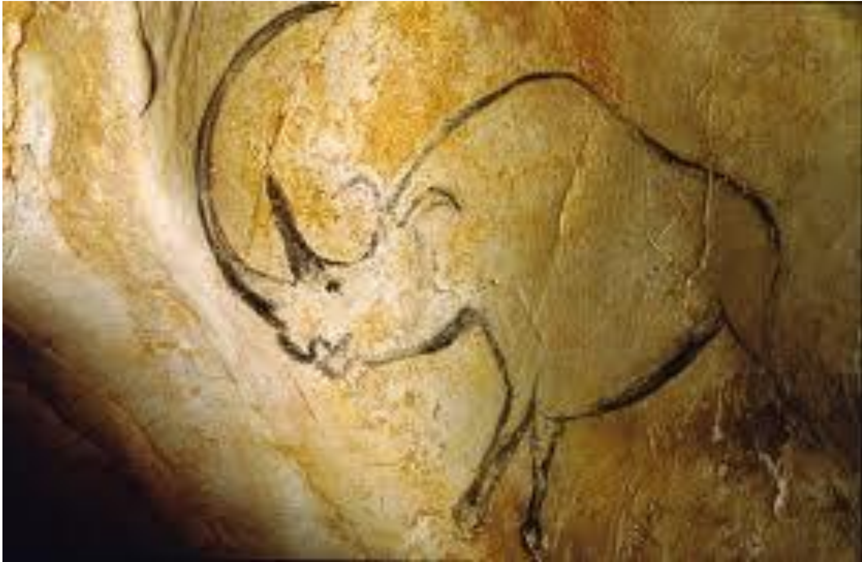
GROTTE CHAUVET (France)