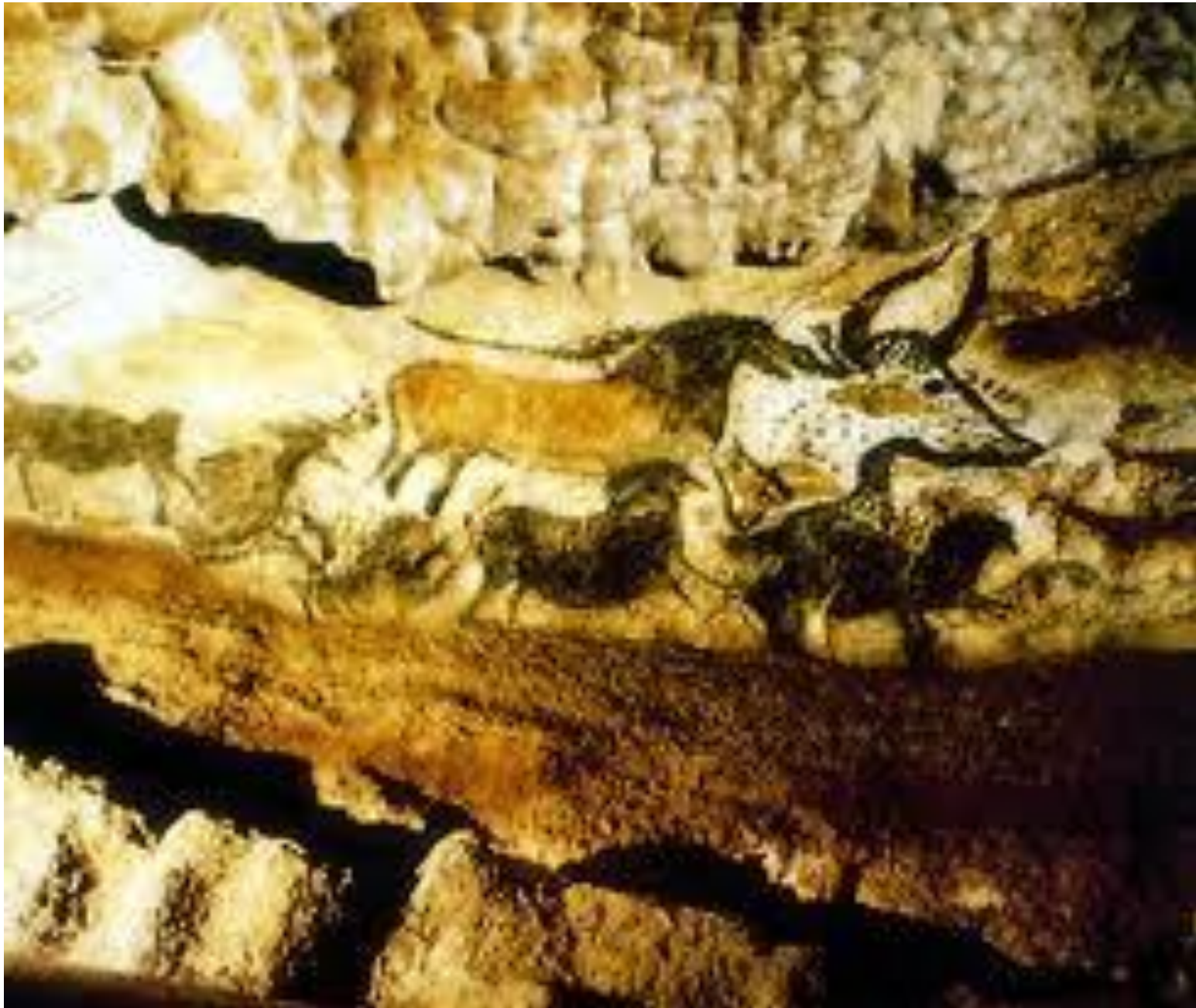
GROTTE DE LASCAUX (France)