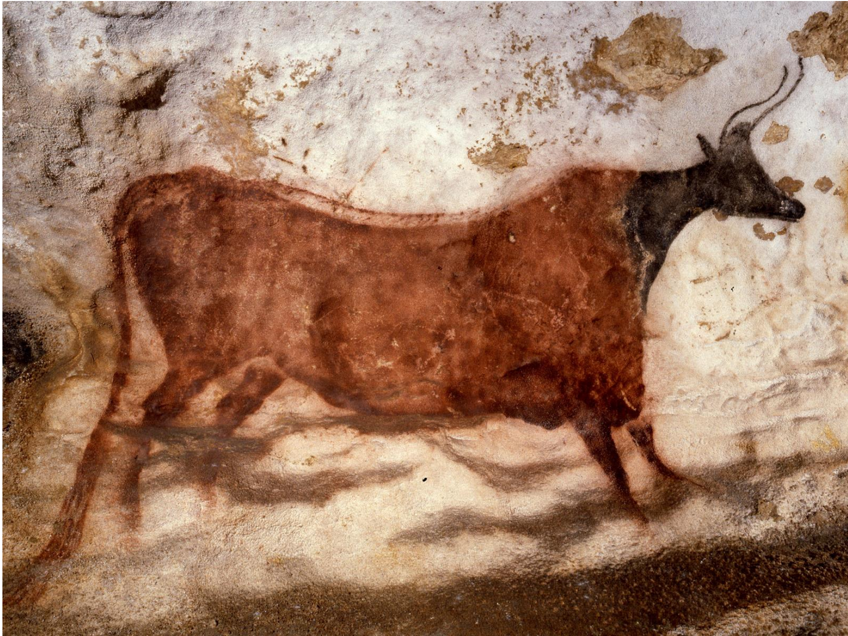
GROTTE DE LASCAUX (France)