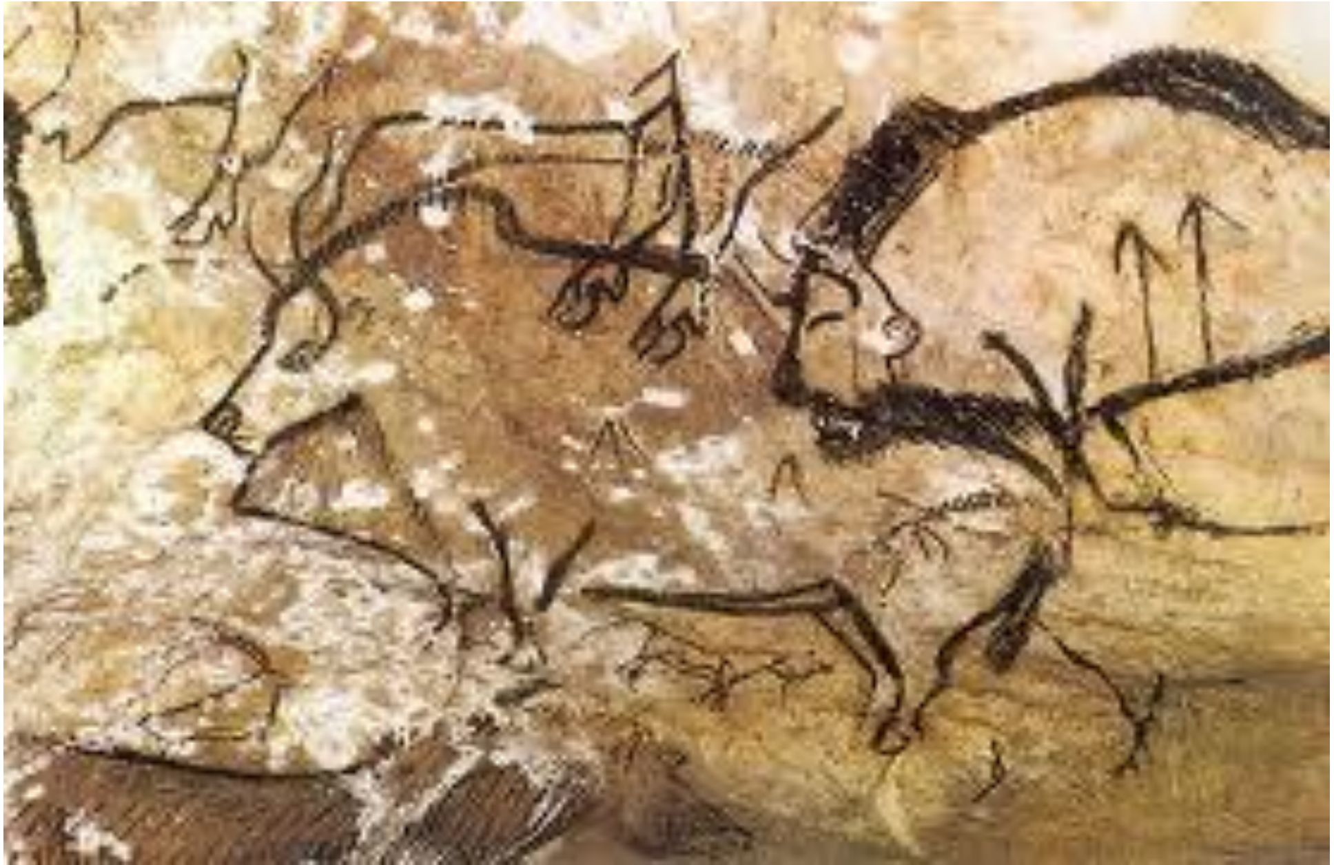
GROTTE DE NIAUX (France)