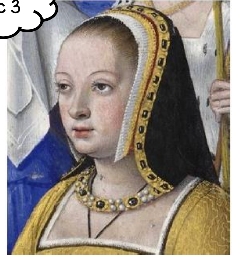
Anne de Bretagne, deux fois reine de France

Héritière du duché de Bretagne, Anne épouse, à 13 ans, Maximilien d'Autriche, l'héritier du Saint Empire romain germanique. Le roi de France, Charles VIII, envahit la Bretagne et fait annuler le mariage. Pour retrouver la paix, Anne, âgée de 14 ans, épouse Charles VIII et devient reine de France. Le roi de France récupère ainsi la Bretagne. A la mort du roi en 1498, Anne se remarie avec le nouveau roi de France (Louis XII) : elle devient reine de France une seconde fois. Sa fille aînée, Claude, épouse le futur roi de France François Ier. Ainsi, la Bretagne est définitivement rattachée au royaume de France.