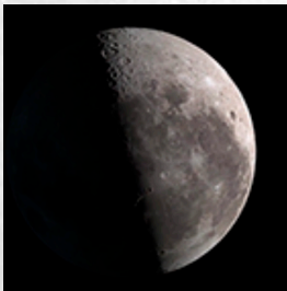
le premier quartier