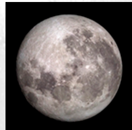
la pleine lune