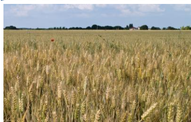
Champ de blé