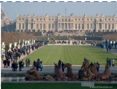
Le château de Versailles

Pour chaque photo indique quelle branche économique est concernée : agriculture (A), services (S), tourisme (T), industrielle (I)