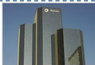
Tour Total à la Défense