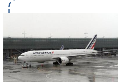
Aéroport Charles de Gaulle