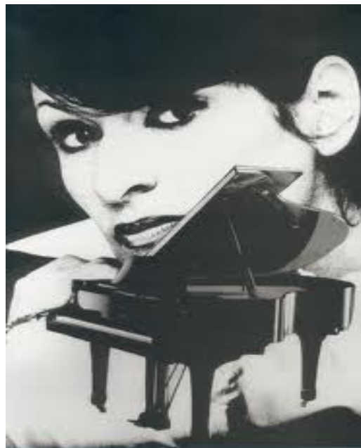
Barbara avec son piano