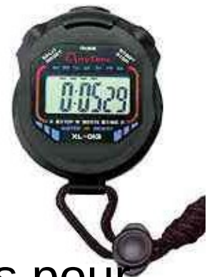
D'autres objets pour mesurer le temps