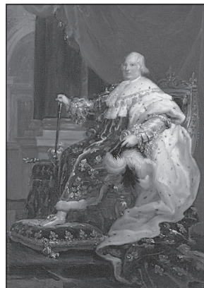
B Louis XVIII en costume de sacre (1815-1824).