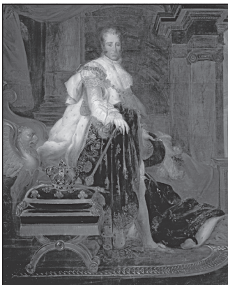
A Charles X en costume de sacre (1824-1830).