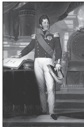
C Louis-Philippe, roi des Français (1830-1848).