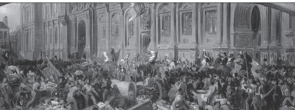
E Lamartine devant l'Hôtel de Ville de Paris le 25 février 1848, peinture de Félix Philippoteaux. En 1848, l'écrivain et député Lamartine, dans un discours célèbre, fait du drapeau tricolore le symbole de la République.