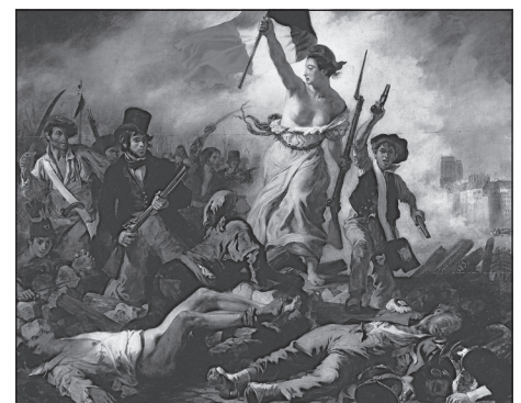
F La liberté guidant le peuple, d'Eugène Delacroix, illustre la révolution de 1830.