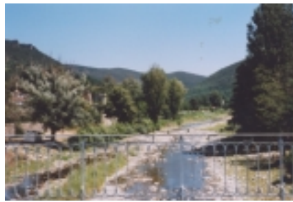
La rivière "Le Gardon"