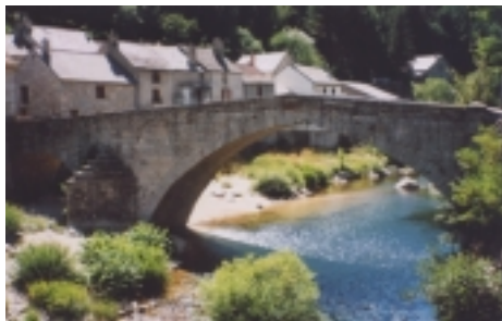
Le Pont de Montvert

Les Cévennes en images