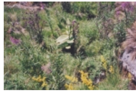
Les fleurs de montagne