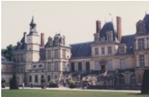
Château de Fontainebleau

Fontainebleau en images