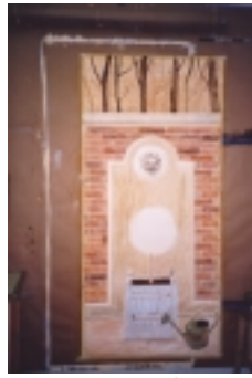
Trompe l'œil en cours de réalisation