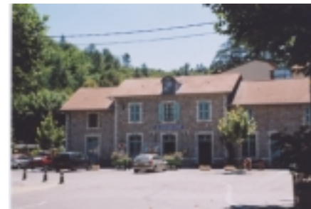
La gare de Saint-Jean-du-Gard