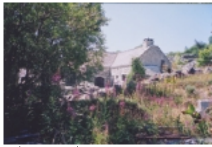
Maison en pierres