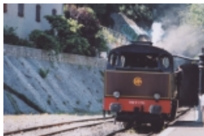
La liaison de Saint-Jean à Anduze