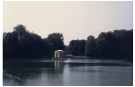
Le parc du château