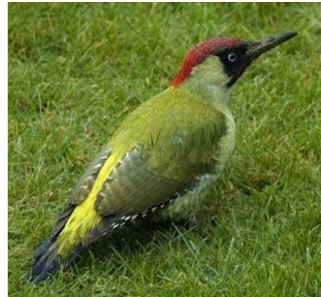
Un pic vert