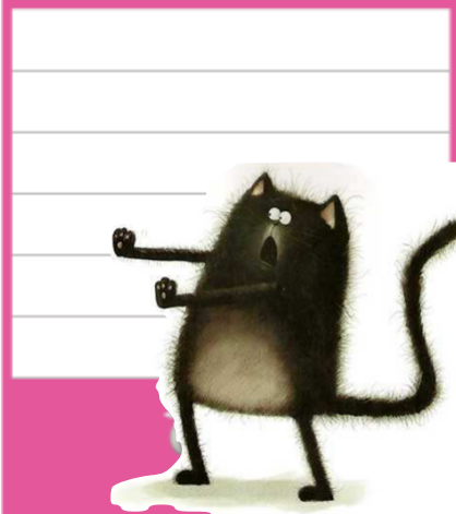
Hélène La Branche pour Le cartable de Mamouschat