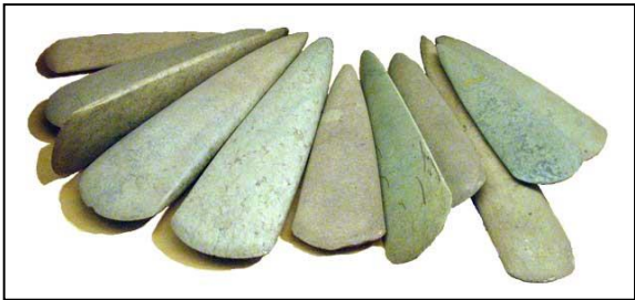
Un polissoir : pour polir les pierres