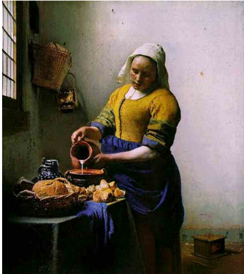
La laitière, Johannes Vermeer