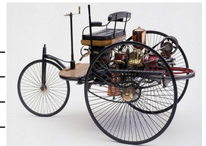
Motorwagen de Benz (1886)

/3 5. Quelle invention voit le jour au milieu du 19ème siècle ? Quels sont ses avantages par rapport à la machine à vapeur ?