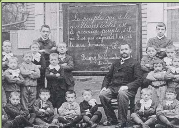
Photo d'une classe Jules Ferry.