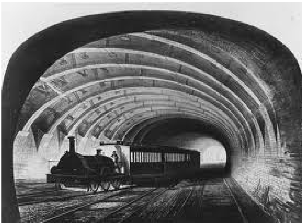
Premier métro de Londres

Imaginé par Charles Pearson, le premier métro du monde est inauguré à Londres à 6 heures du matin. La ligne longue de 4 miles (6,5 kilomètres) permet de rallier Farringdon street à Paddington. Malgré les problèmes d'aération, il fonctionne à la vapeur. Durant cette première journée, le "London Metropolitan" transportera près de 30 000 passagers .