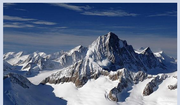
Massif des Alpes