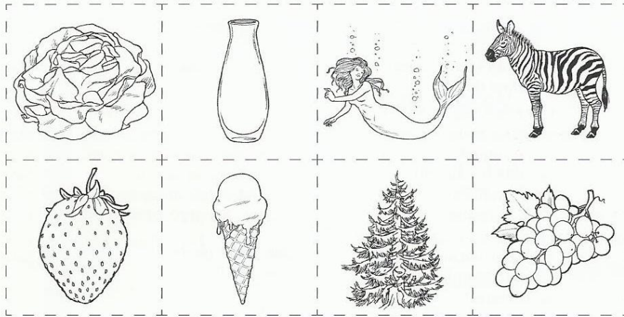
salade - vase - sirène - zèbre fraise - glace - sapin - raisin