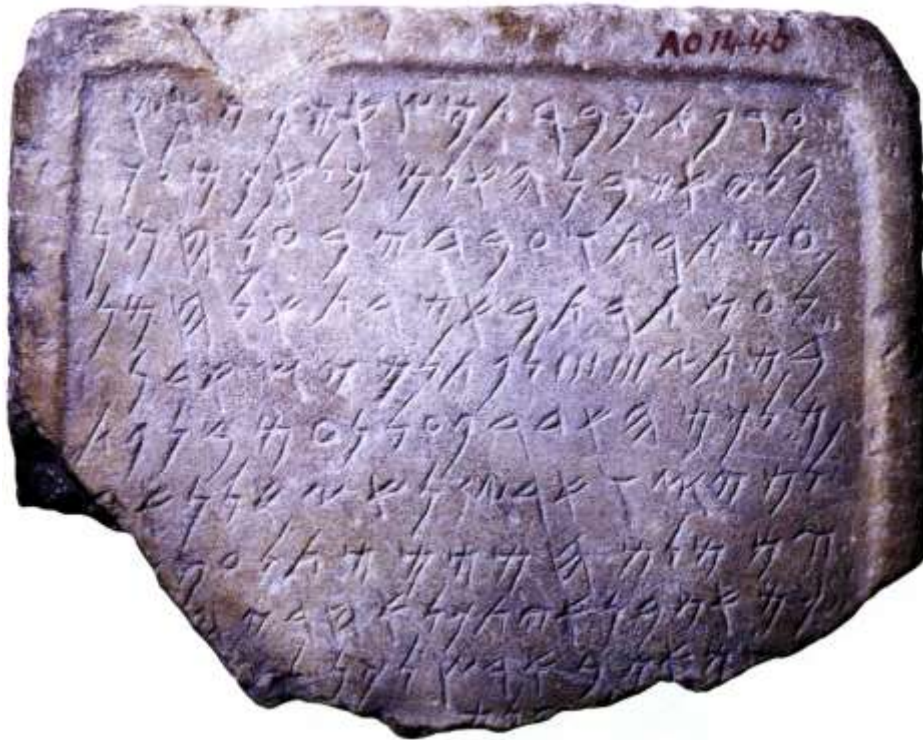
Taolennig vaen warni ur skrid fenikiek