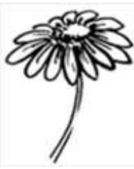
une marguerite une marguerite