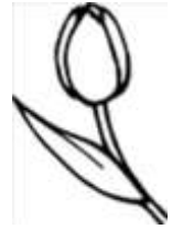
une tulipe une tulipe