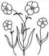
boutons d'or boutons d'or