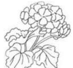
un géranium un géranium