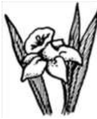
une jonquille une jonquille