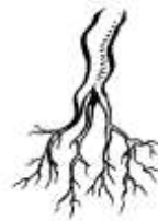
des racines des racines