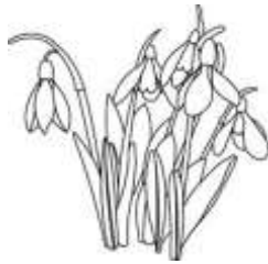
un perce-neige un perce-neige