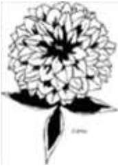
un dahlia un dahlia