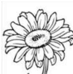
un tournesol un tournesol