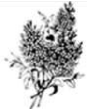
du lilas du lilas