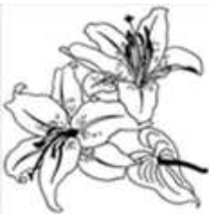
des lys des lys