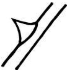
une épine une épine