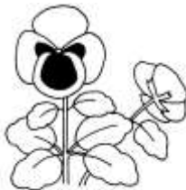
une pensée une pensée