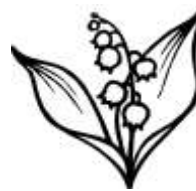
du muguet du muguet