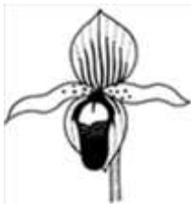
une orchidée une orchidée