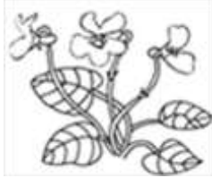
des violettes des violettes