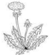
un pissenlit un pissenlit