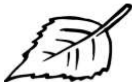
une feuille une feuille