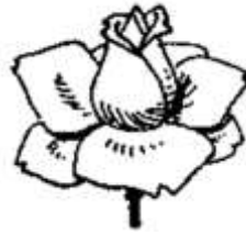
une rose une rose