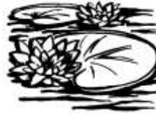
un nénuphar un nénuphar