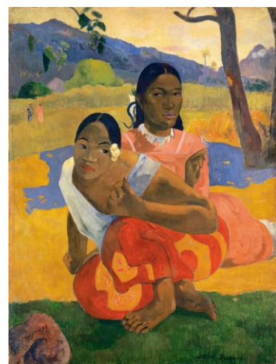
Quand te maries-tu ? (peint en 1892 en Polynésie Française)