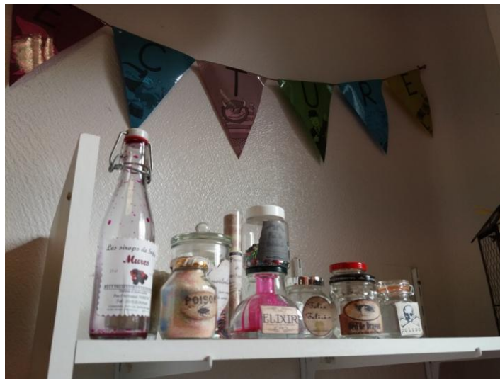
LES POTIONS DE L'APOTHECAIRE

La voie 9 \frac{3}{4} juste à l'entrée de ma classe