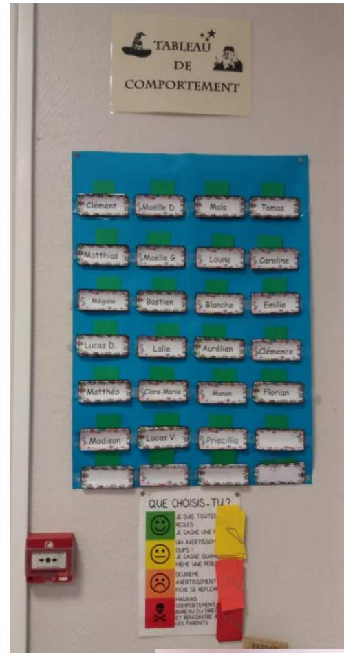
TABLEAU DE COMPORTEMENT Vous voyez aussi à droite le tableau des devoirs