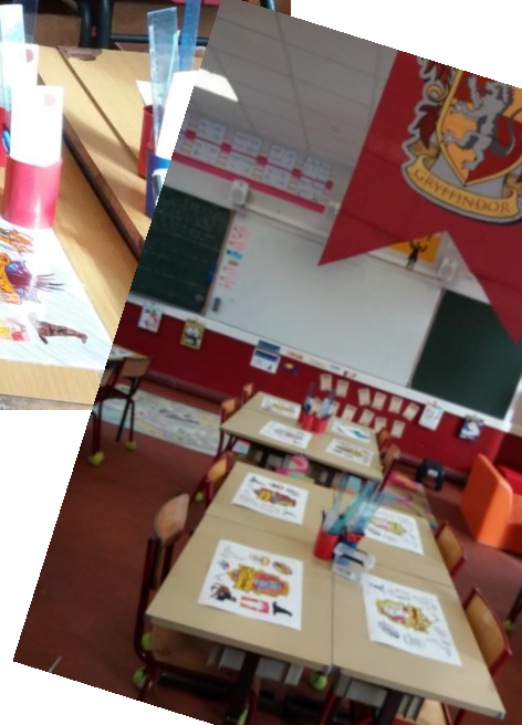
Vu d'ensemble de la classe