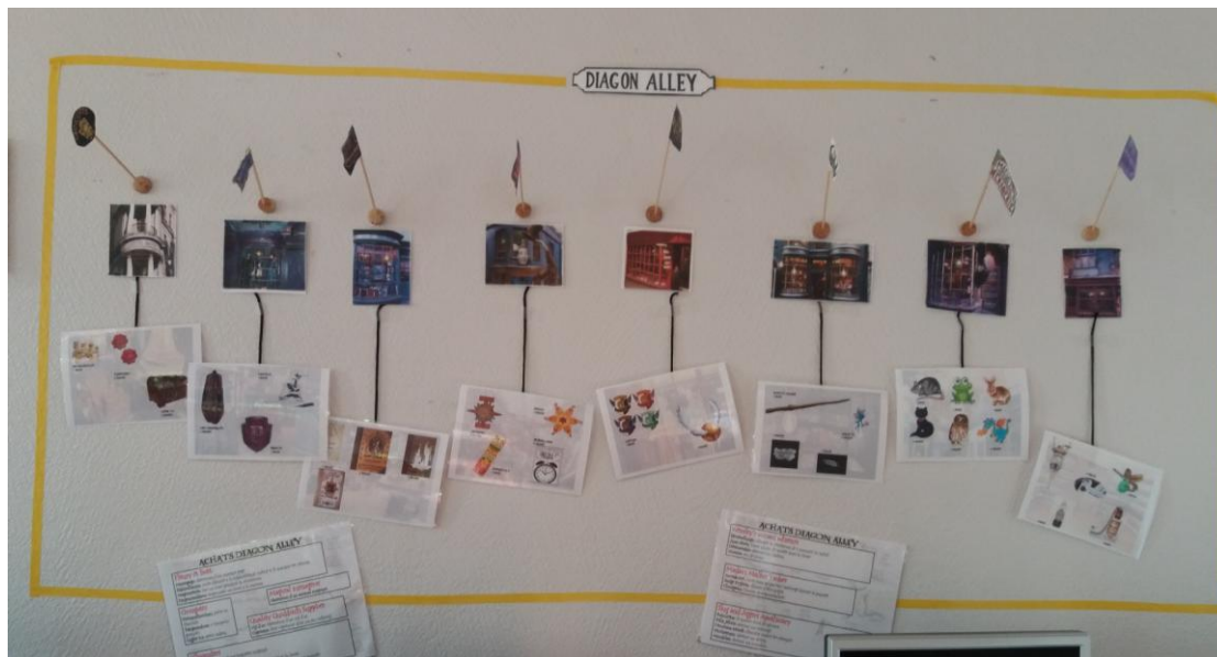
CHEMIN DE TRAVERSE