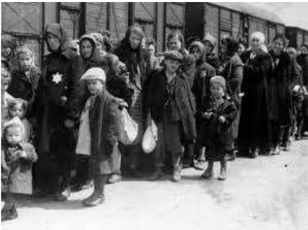
Personnes arrivant dans un camp.

L'inscription au-dessus de l'entrée « Arbeit macht frei » signifie « le travail rend libre ».