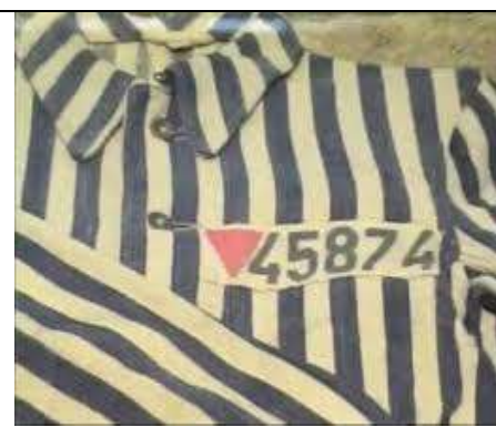
Un triangle rose

Pendant les années de guerre (1939 à 1945), les nazis et leurs collaborateurs créèrent des ghettos, des camps de transit et des camps de travaux forcés. Afin d'atteindre leurs objectifs, les nazis arrêtaient les personnes recherchées (hommes, femmes, enfants, personnes âgées), et les envoyaient dans des camps de transit, lieux de regroupement. Les gens étaient ensuite transportés en train vers les camps de concentration qui devinrent durant la guerre des camps d'extermination , c'est à dire des lieux où les gens étaient exécutés en masse. Le mot « déporté(es) » désigne toutes les personnes qui ont été arrêtées et envoyées dans un camp de concentration. On parle alors de « déportation ».