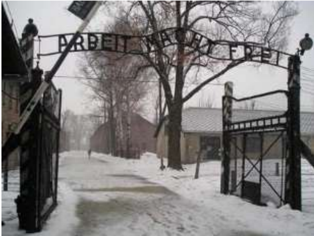
Entrée du camp de concentration d'Auschwitz.

L'inscription au-dessus de l'entrée « Arbeit macht frei » signifie « le travail rend libre ».