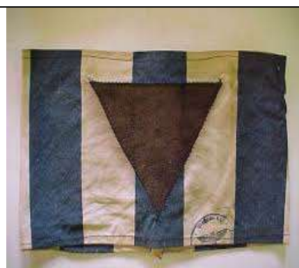
Un triangle noir