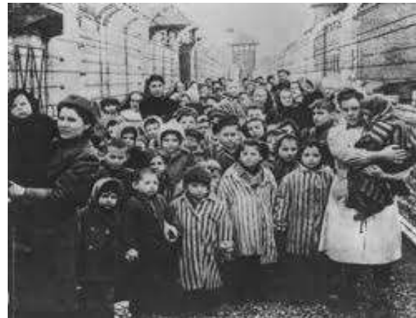
Femmes et enfants dans un camp

Tous les gens déportés ne sont pas morts, mais de nombreuses personnes furent massacrées dans les camps de concentration. Ce sont les juifs qui furent les plus touchés par cette politique raciale, dans le cadre de la "Solution finale" : la politique nazie d'extermination des Juifs d'Europe.