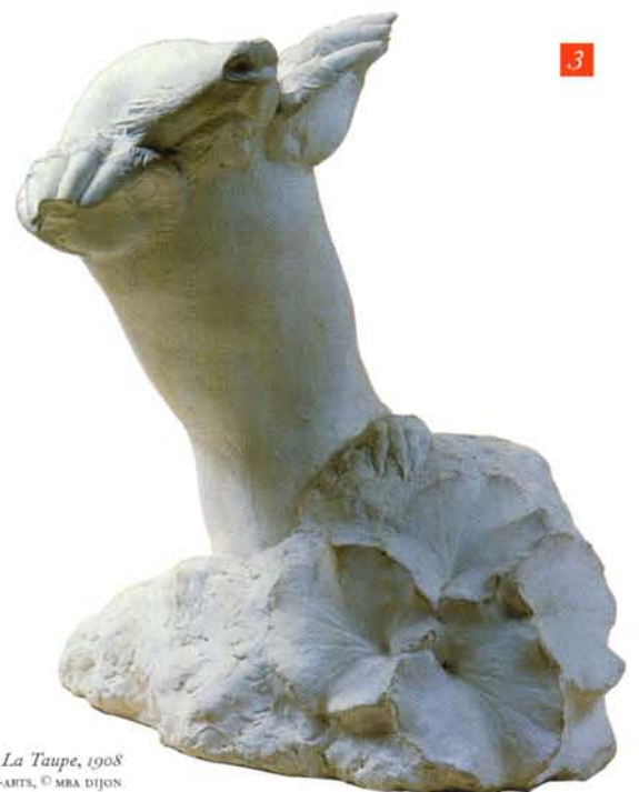
FRANÇOIS POMPON, La Taupe , 1908 DIJON, MUSÉE DES BEAUX-ARTS, © MBA DIJON

En 1908, il expose une Taupe audacieuse par le choix du sujet et par la technique (fig. 3). Pompon se souvient des leçons de son maître Rodin : "C'est en copiant la nature que vous trouverez votre personnalité" et "copier la nature ne consiste pas à la reproduire trait pour trait".