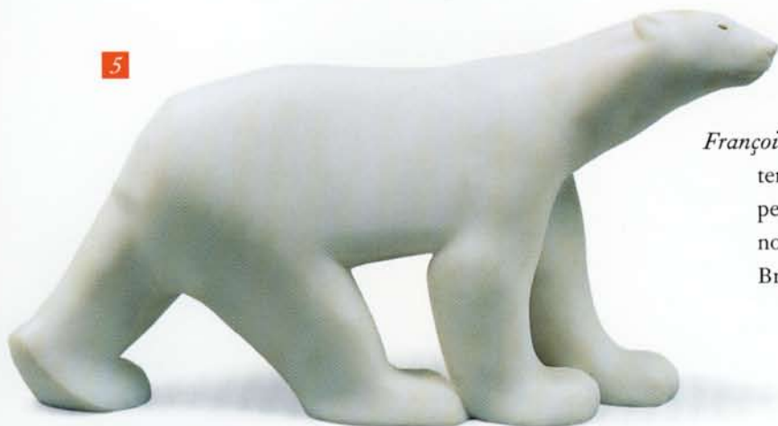
FRANÇOIS POMPON, L'ours blanc, 1923 - 1933 DIJON, MUSÉE DES BEAUX-ARTS