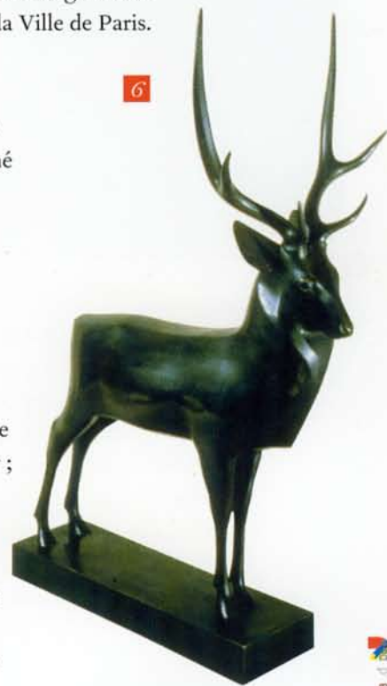
FRANÇOIS POMPON, Le grand cerf , 1929 DIJON, MUSÉE DES BEAUX-ARTS

Décédé sans postérité , François Pompon lègue à l'Etat tout son atelier ; ses œuvres sont alors déposées au Museum d'Histoire Naturelle de Paris, au Musée des Beaux-Arts de Dijon, au Musée de Saulieu.