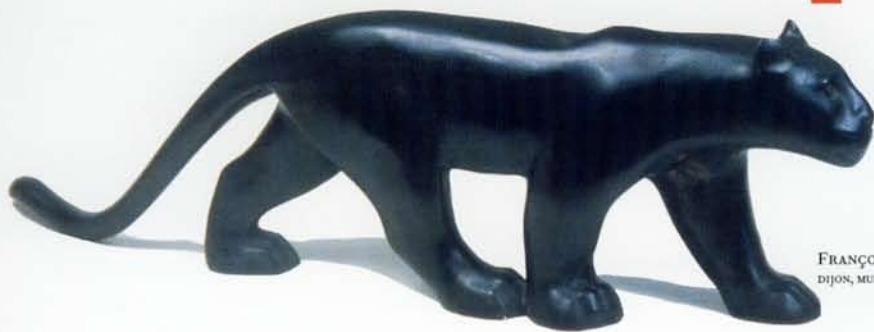
FRANÇOIS POMPON, La grande panthère noire , 1931 DIJON, MUSÉE DES BEAUX-ARTS, © MBA DIJON

Il se fabrique un petit établi portatif qu'il pend autour de son cou et qui lui permet de modeler sur le vif son sujet avec de la glaise. Tous les animaux l'intéressent et le fascinent : animaux domestiques, animaux de la ferme et de la forêt l'été à la campagne et animaux exotiques le reste de l'année au Jardin des Plantes (fig. 4).