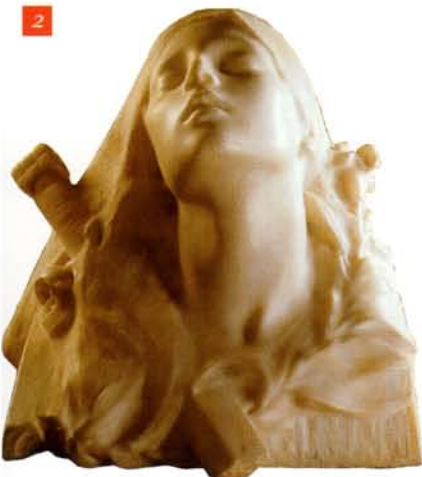
FRANÇOIS POMPON, Sainte Catherine , 1888 SAULIEU, MUSÉE FRANÇOIS POMPON

En 1879, il expose pour la première fois au Salon des Artistes Français des portraits en buste ; Il se fait remarquer pour son Buste de Sainte Catherine, martyre chrétienne (1886) (fig. 2) et sa Cosette (1888), pour lesquels il obtient des prix.