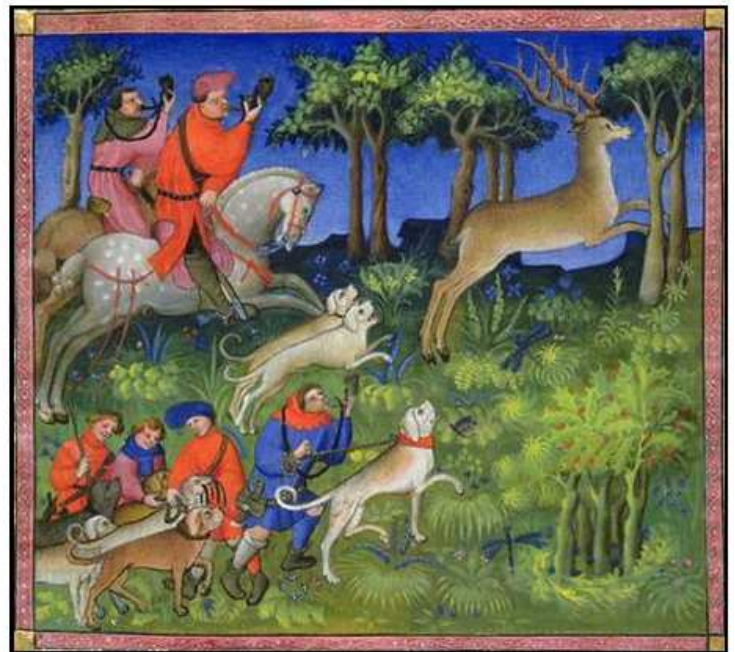
livre de chasse Gaston Phebus - XIV e siècle