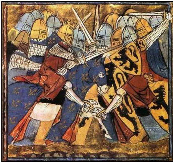
Chevaliers - enluminure du XIV e siècle