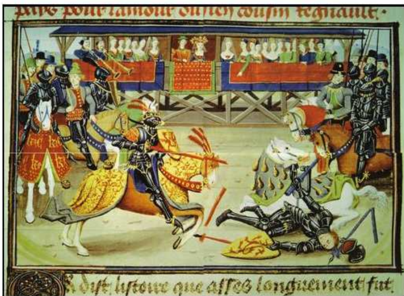
Un tournoi - enluminure