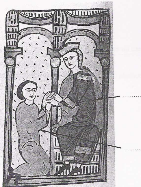
Document 3 : Scène d'hommage, miniature, XII e siècle

Cité par Boutruche, Seigneurie et féodalité