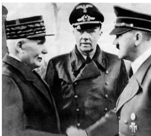
Le maréchal Pétain rencontre Hitler

C'est le début de la collaboration (= aide apportée par certains Français aux Allemands). Des Français dénoncent leurs voisins résistants ou juifs, d'autres travaillent volontairement pour les Allemands.