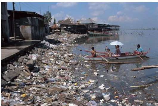
Pollution par rejet de déchets à la mer