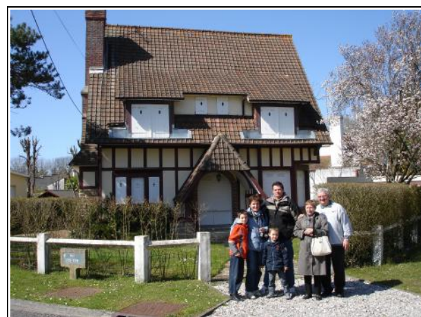
La Chaumière – Villa Lucien Dufour

Compte tenu de l'énorme succès de nos balades à vélo pour découvrir les villas anciennes et l'histoire de la station, et en fonction des contraintes sanitaires en vigueur, nous afficherons sur le panneau d'affichage Place Sapin à Stella, les dates et horaires de nos balades que nous pourrions organiser, une en juillet et une en août.