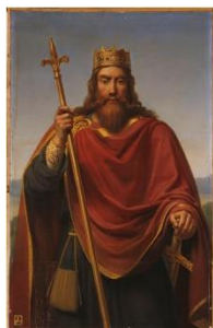
Clovis roi des Francs, Dejunne François-Louis (1786/1844) Huile sur toile, 1,45 x 0,92, MV 2.

* Le total du meilleur score possible est de 10 points.