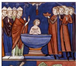
Baptême de Clovis, Illustration dans Vie de Saint-Denis , milieu du XIII ème siècle, Bibliothèque nationale de France.

* Le total du meilleur score possible est de 10 points.