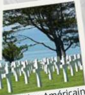
Cimetière Américain Colleville-sur-mer