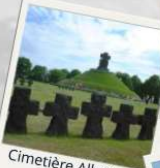
Cimetière Allemand La Cambe