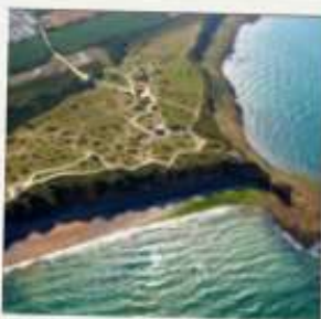
Pointe du Hoc