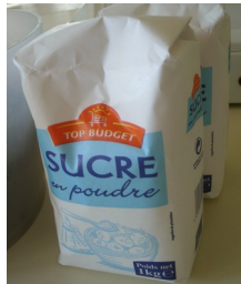
Du sucre (400g)