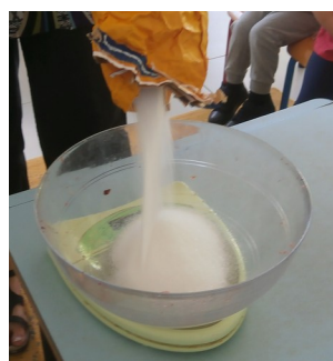
3/ PESER LE SUCRE