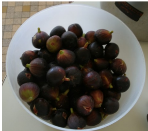
Des figes (1kg)