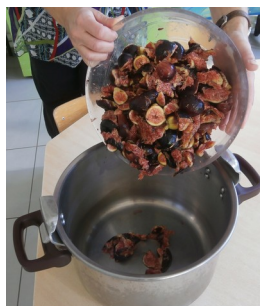
2/ VERSER LES FIGES DANS LA COCOTTE MINUTE