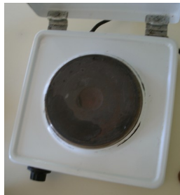
une plaque électrique