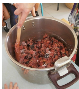
REMUER LE SUCRE ET LES FIGES