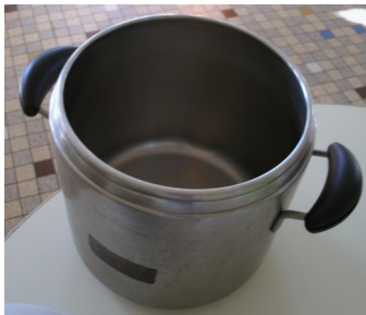
Une cocotte minute