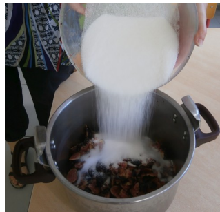
VERSER LE SUCRE SUR LES FIGES