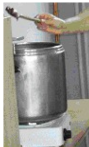
FAIRE CUIRE ET METTRE EN POT