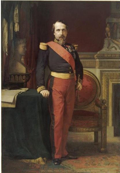
Document 1 : Napoléon III

La Seconde République est proclamée le 24 février 1848. Elle institue le suffrage universel (uniquement pour les hommes) qui permettra aux citoyens de s'exprimer par le vote. Elle abolit définitivement l'esclavage dans les colonies françaises, rétablit la liberté de presse et de réunion. Pour donner du travail aux ouvriers au chômage, elle instaure des ateliers nationaux . Mais ils sont mal organisés et de plus en plus d'ouvriers y participent. Devant cet afflux, ils doivent être supprimés. Cette décision est à l'origine d'un soulèvement ouvrier en juin 1848, durement réprimé par l'armée. La République devient autoritaire. En décembre 1848, le neveu de Napoléon, Louis-Napoléon Bonaparte est élu président de la IIème République. Mais rapidement, il s'empare de tous les pouvoirs et, le 2 décembre 1851, il supprime la République lors d'un coup d'état. Il prend le titre de Napoléon III et rétablit l'Empire en 1852.