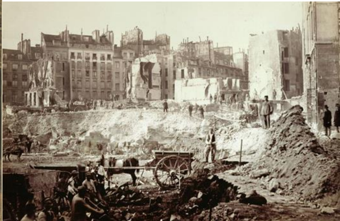
Document 2 : Les travaux du baron HAUSSMANN à Paris

Napoléon III gouverne de manière très autoritaire. La censure est très forte et les réunions sont interdites, mais l'économie est prospère. La France entre dans l'ère industrielle. L'industrie sidérurgique se développe en même temps que le chemin de fer. De grands travaux sont entrepris dans Paris sous la direction du préfet Haussmann . Les quartiers insalubres sont détruits pour faire place à des immeubles modernes, de grandes avenues sont percées, on crée des espaces verts et de grands magasins. Les rues sont éclairées au gaz. La ville est dotée d'un réseau d'égouts et d'eau potable. Mais Napoléon III veut redonner à la France sa puissance passée. En 1870 Il déclare donc la guerre à la Prusse mais c'est un échec cuisant. L'empereur est fait prisonnier à Sedan le 2 septembre 1870. Un gouvernement provisoire est créé dans l'urgence et la République est proclamée.