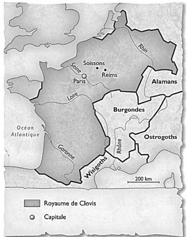
Doc. 2 La Gaule en 511, à la mort de Clovis.