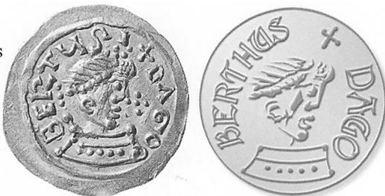
Monnaie mérovingienne représentant Dagobert.

Le roi Dagobert fut l'un des rois les plus brillants et les plus populaires de l'époque mérovingienne. Il fit de nombreuses conquêtes, créa des monastères et se déplaça dans ses territoires pour rendre la justice. Il eut comme principaux conseillers des hommes remarquables comme saint Ouen, saint Didier et surtout saint Éloi comme le dit la chanson !