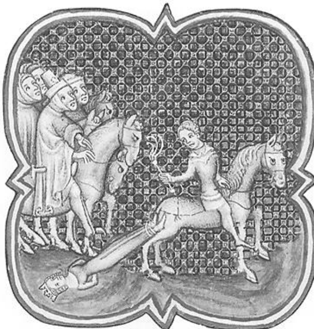
Le supplice de Brunehaut (manuscrit, vers 1375-1380).

L'époque mérovingienne est marquée par la violence, les meurtres et les pillages. Les rois, mais aussi les reines, étaient cruels. Ainsi, la reine Brunehaut qui épousa un petit-fils de Clovis fut accusée d'avoir tué plus de dix rois. Le fils de l'une de ses victimes se vengea : elle fut attachée à la queue d'un cheval qui, dans sa course, lui brisa les os.