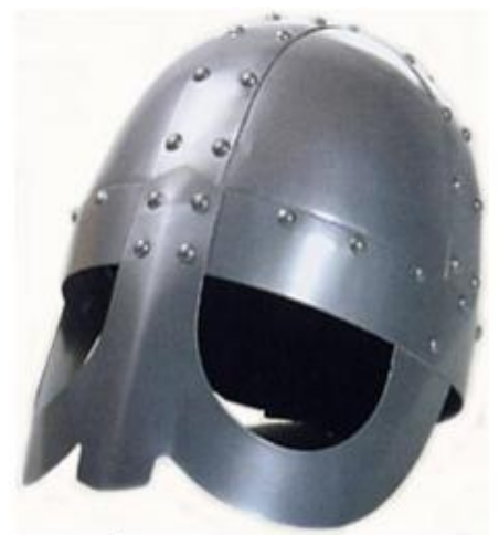
Doc. 5 Casque franc (vi e siècle).