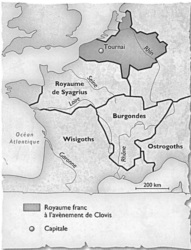
Doc. 1 La Gaule en 481, lorsque Clovis devient roi.