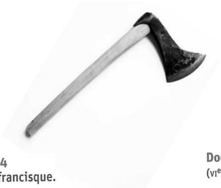
Doc. 4 Une francisque.

6) Que nous apprend ce texte sur la personnalité de Clovis?