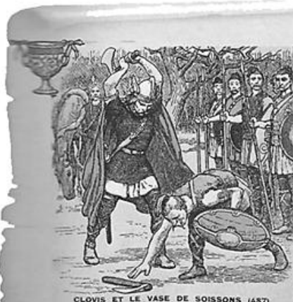
CLOVIS ET LE VASE DE SOISSONS (487) Illustration, L'Histoire des Francs , 1935.

7) Quelles indications nous donnent les docs 4 et 5 sur les Francs?