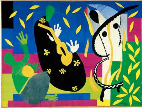
Polynésie, la mer, 1946