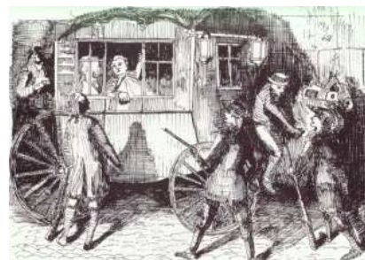
La fuite du roi en 1791.