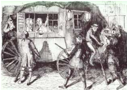
La fuite du roi en 1791.