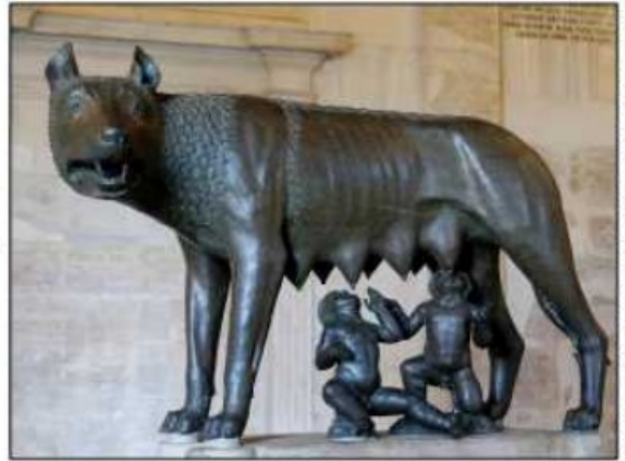
Lupa Capitolina : louve avec Romulus et Rémus. Bronze, œuvre du XIII e siècle. (les jumeaux sont un ajout du XV e siècle).

Ils étaient les fils du dieu Mars et d'une prêtresse. Mais leur oncle jaloux ordonna qu'on les mette dans un panier et qu'on les abandonne sur le fleuve Tibre . Le panier échoua sur une colline et les jumeaux furent allaités par une louve.