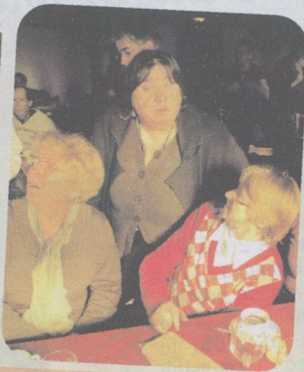
Journée communautaire entre comp, resp et amis (28 oct)