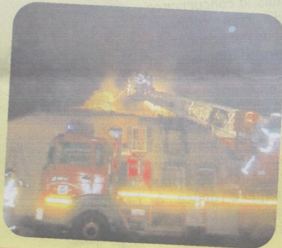
Incendie aux Papillons(30 oct)... que des dégâts matériels...