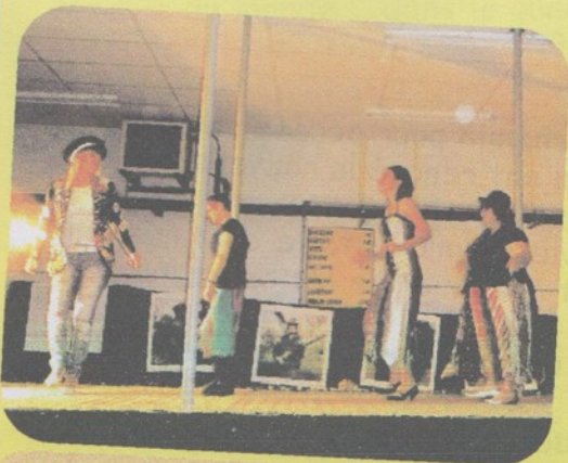
Défilé de mode pour Journée Portes Ouvertes du Chantier d'Insertion (19 nov)