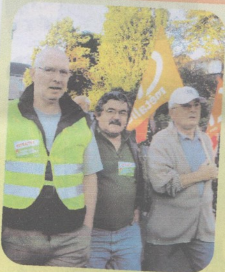
Manif à Bressuire (28 oct)