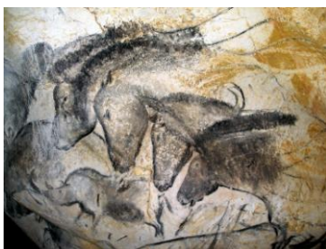
Grotte de Chauvet