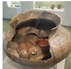
Urne d'une tombe