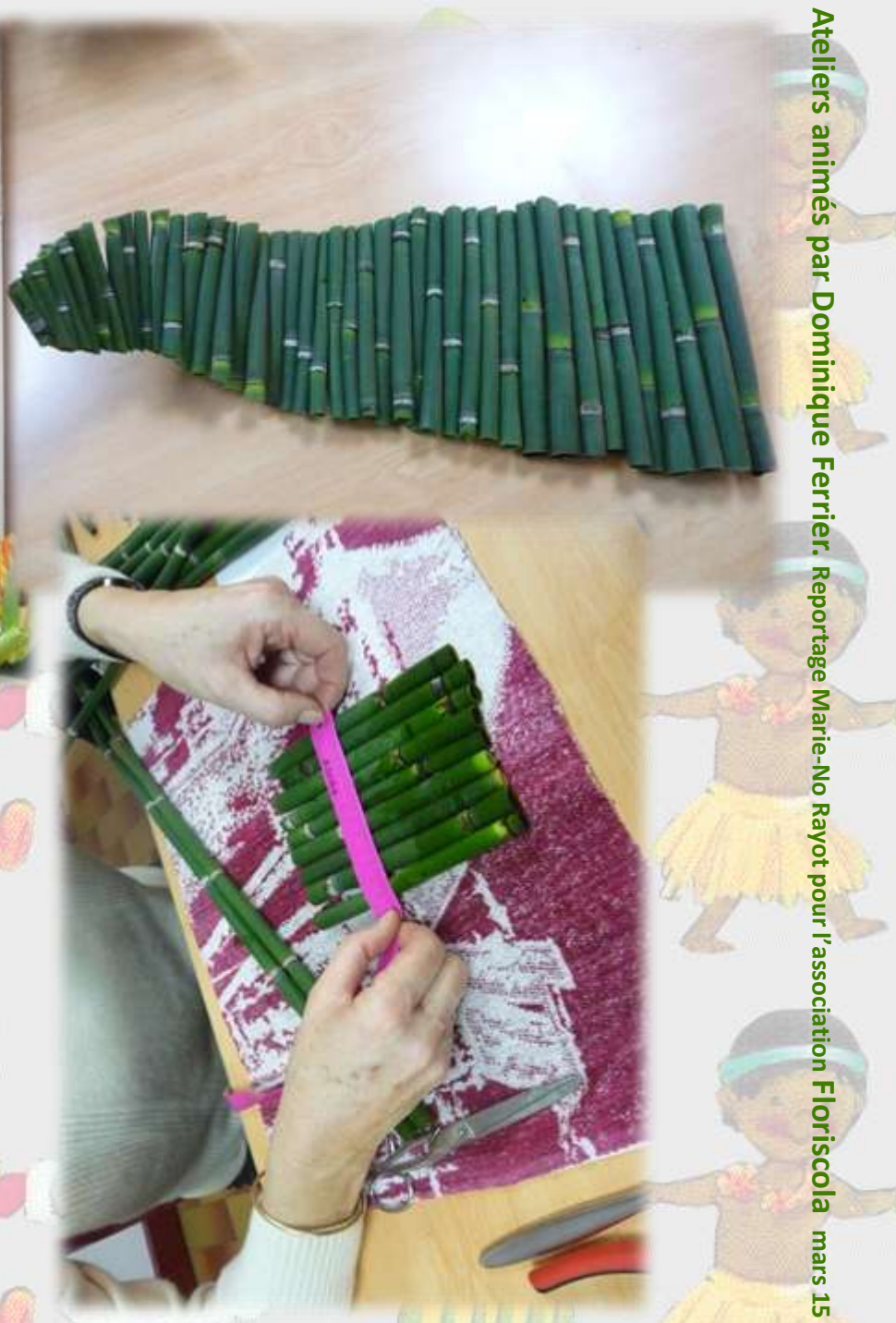
Ateliers animés par Dominique Ferrier. Reportage Marie-No Rayot pour l'association Floriscola mars 15