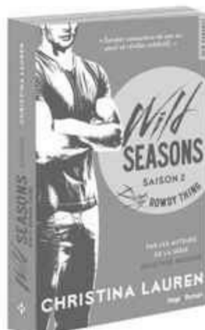
DIRTY ROWDY THING SAISON 2 - JUIN 2015