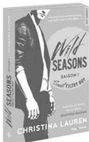
SWEET FILTHY BOY SAISON 1 - AVRIL 2015