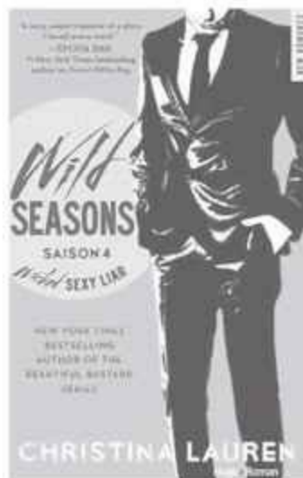
WICKED SEXY LIAR SAISON 4 À PARAÎTRE EN 2016