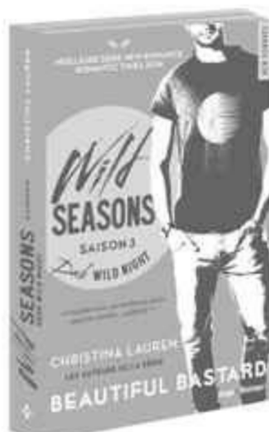
DARK WILD NIGHT SAISON 3 - OCTOBRE 2015