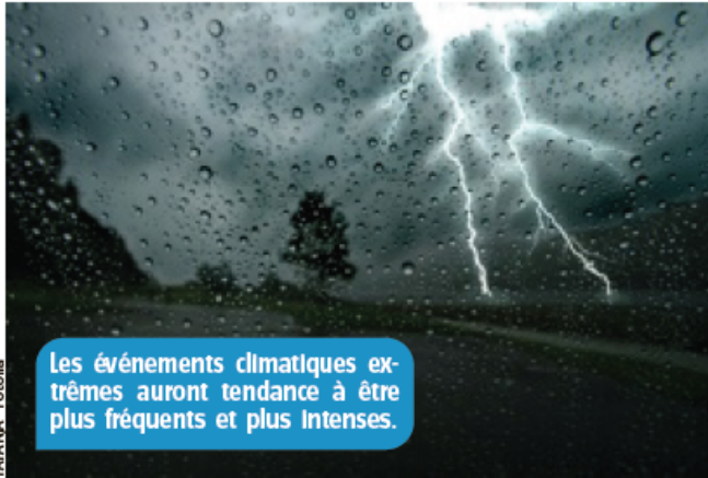
Les événements climatiques extrêmes auront tendance à être plus fréquents et plus intenses.

La température moyenne de la Terre augmente mais la situation actuelle n'est qu'un début. Comme les gaz rejetés dans l'atmosphère mettent des dizaines d'années à disparaître, le GIEC (groupe d'experts du monde entier qui étudie l'évolution du climat) prévoit que la température moyenne de la Terre va continuer à grimper au cours du 21 e siècle (années 2000). Et cela, même si on arrête tout à coup de rejeter trop de GES dans l'air.