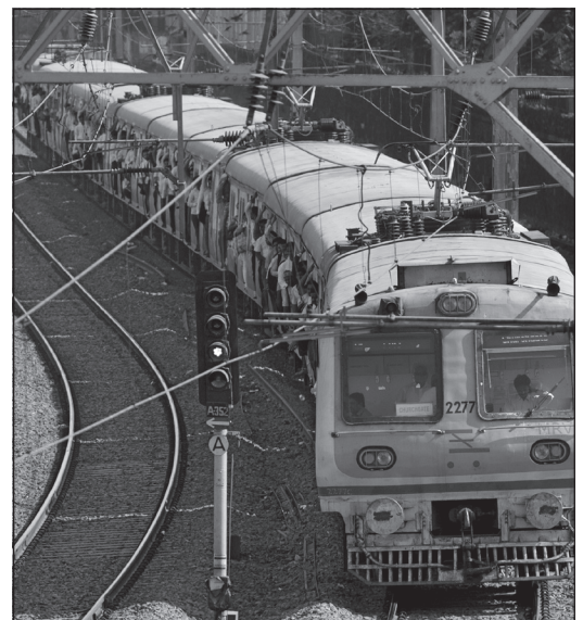
Doc. 3 Train assurant les transports.

D'après J. Bouissou, journal Le Monde , 26/09/2013.