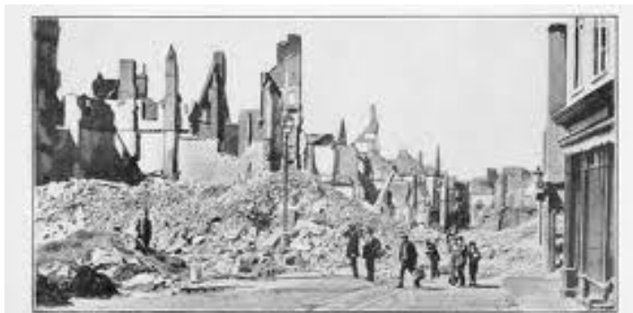
La ville de Louvain en ruine en 1915.

La guerre a couté très chers à tous les pays concernés.