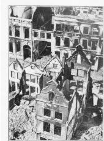
Vue de la ville de Termonde après un bombardement.