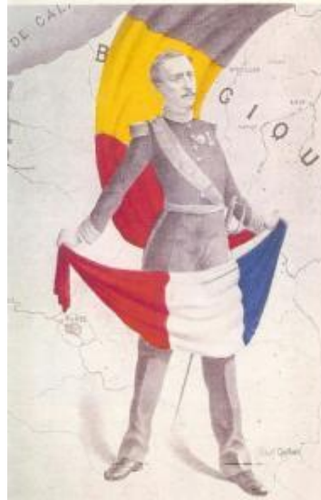
VOUS NE PASSEREZ PAS

31 octobre — « A l'extrême gauche du front, les inondations provoquées par l'armée belge dans la vallée inférieure de l'Yser ont contraint les forces ennemies qui avaient passé cette rivière à se replier. Elles ont été violemment canonnées par les artilleries belges et françaises, pendant leur mouvement de retraite. »