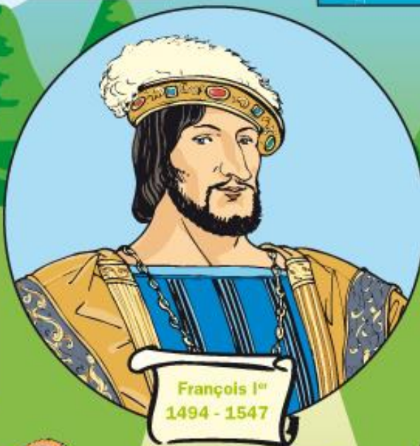
François 1 er 1494 - 1547

En 1516, François 1 er invite le grand Léonard de Vinci en France. Le roi aime beaucoup Léonard qu'il appelle, avec respect et amitié, « Mon père ». À la mort du peintre en 1519, le roi achète la Joconde , son tableau préféré.