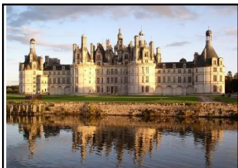
Le château de Chambord