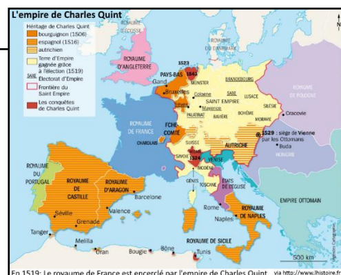
En 1519: Le royaume de France est encerclé par l'empire de Charles Quint.

En 1519, le royaume de France est encerclé par l'Empire de Charles Quint.