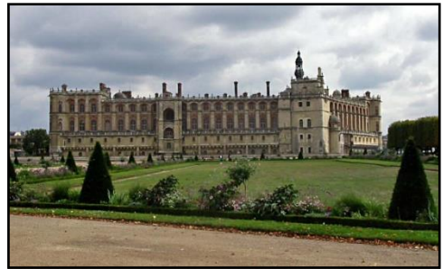
Le château de St Germain en Laye