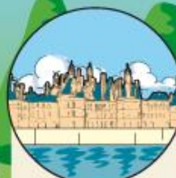
Le château de Chambord, achevé après la mort de François 1 er , compte 440 pièces, 365 cheminées et 63 escaliers.