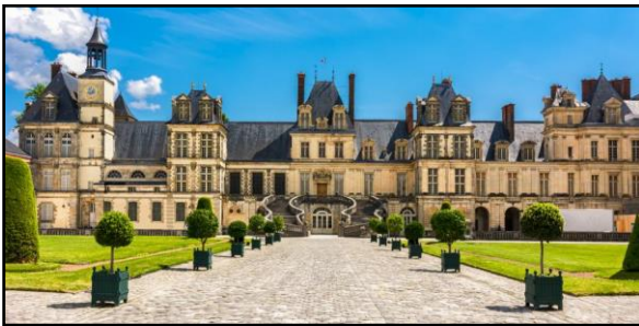
Le château de Fontainebleau

Il fait construire de nombreux châteaux et bâtiments aussi somptueux à l'intérieur qu'à l'extérieur.