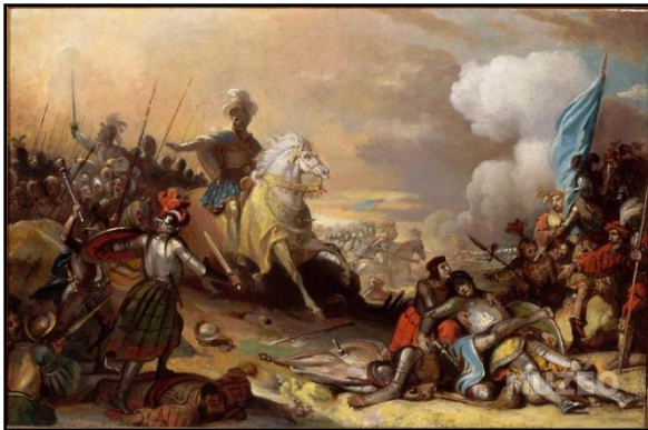
La bataille de Marignan

Dès son arrivée sur le trône, François 1 er reprend les guerres menées contre l'Italie . Il remportera une grande bataille en 1515 à Marignan. C'est une bataille très meurtrière avec plus de 16000 morts. Mais la suite n'est qu'une succession d'échecs.