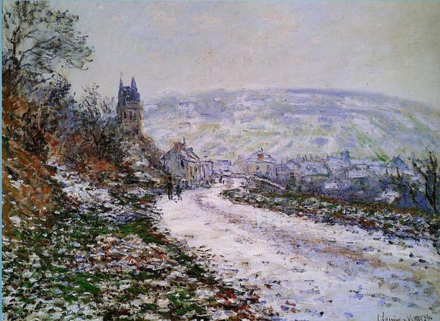
Arrivée au village de Vétheuil en hiver, Claude Monet (1879)