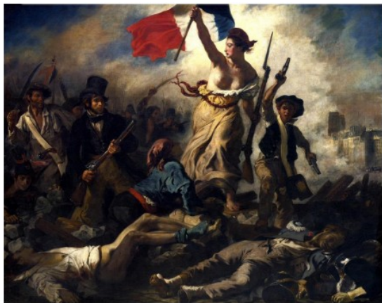
1 Eugène Delacroix, La liberté guidant le peuple , 1830.