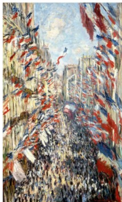
4 Claude Monet, La rue Montorgueil , 1878.