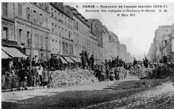
3 Carte postale, 1871.

Chacun de ces tableaux représente un même type d'événement à plusieurs dates différentes. De quoi s'agit-il ?