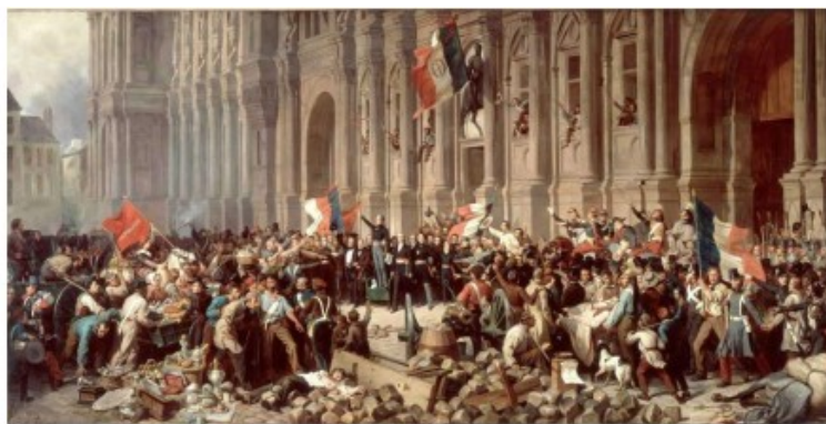
2 Félix Philippoteaux, Lamartine repoussant le drapeau rouge à l'Hôtel de Ville le 25 février 1848 , 1848.