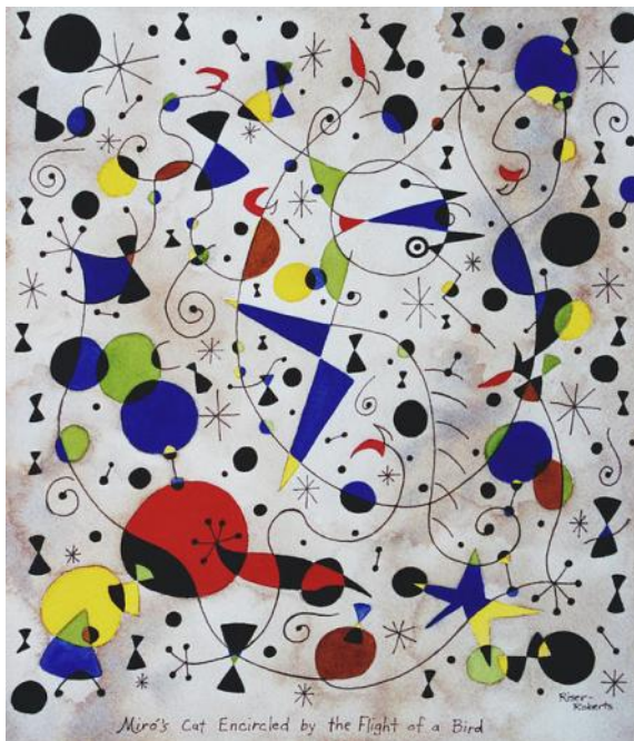
Chat encerclé par le vol d'un oiseau

Nous avons observé quelques uns de ses tableaux.