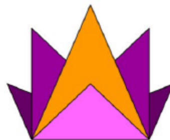
Figure D :