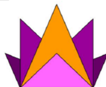
Figure D :