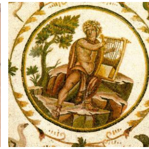
Joueur de lyre