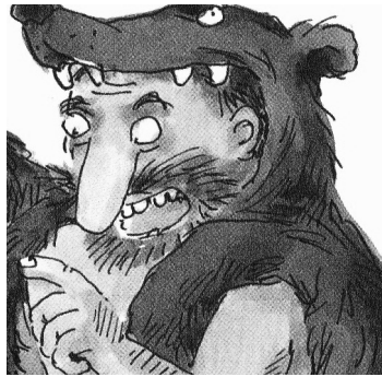
Cradok Le chef et le père