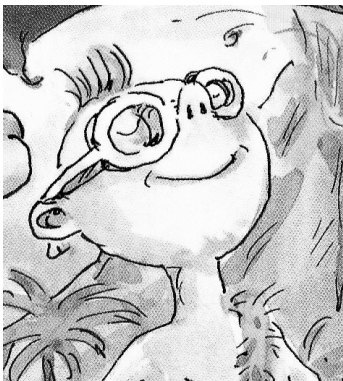
Aimé-les-ongles- propres Le fils