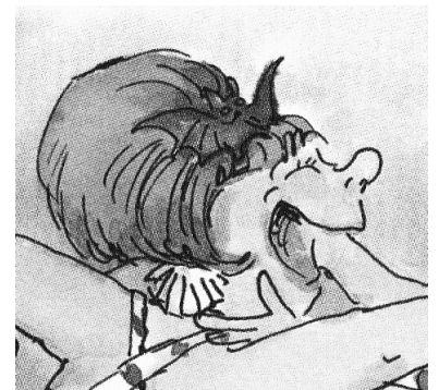
Odorine La mère