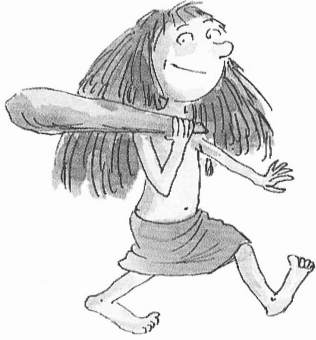
Crapounette La fille