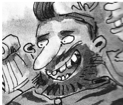
Désiré-Bonne-Haleine Le chef et le père